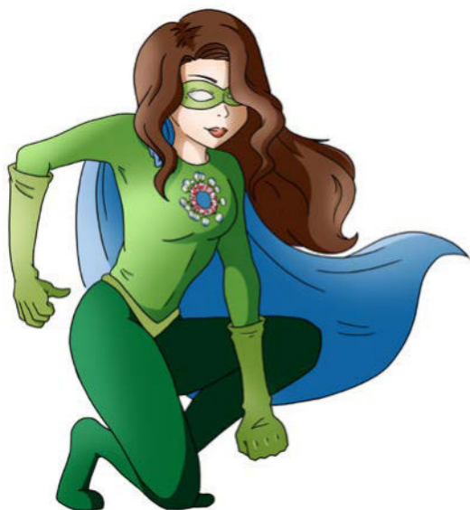
Bilderrätsel Comic-Heldin, Bild: EGW/Melanie Rukaber