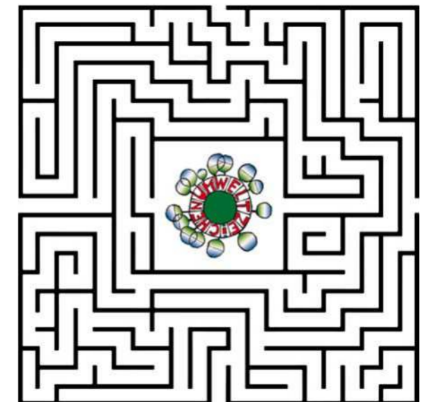
Bilderrätsel Labyrinth

Finde einen der zwei richtigen Wege zum Österreichischen Umweltzeichen.