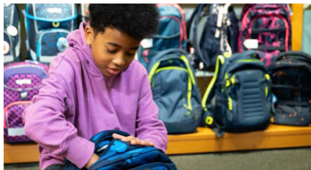
Junge mit Schulrucksack

Besuchen Sie auch: bueroeinkauf.at und umweltzeichen.at