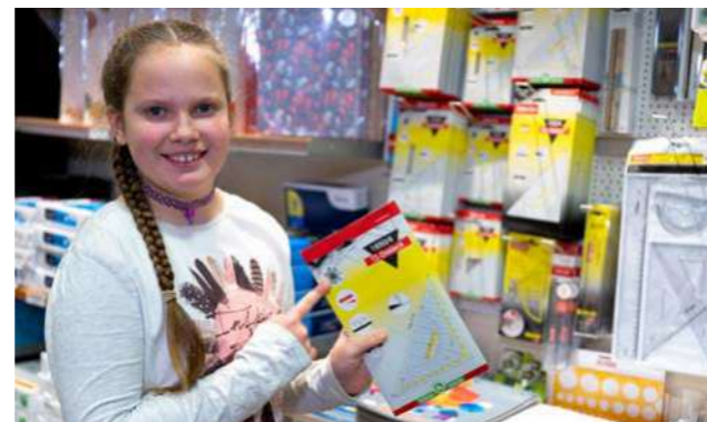
Mädchen mit Geodreieck