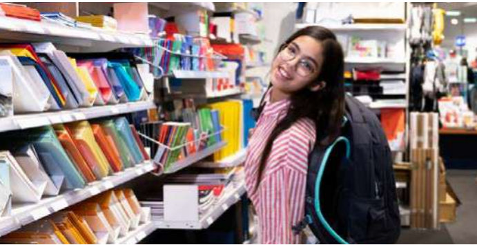
Mädchen mit Schulrucksack, Bild: BMK/Viktoria Miess